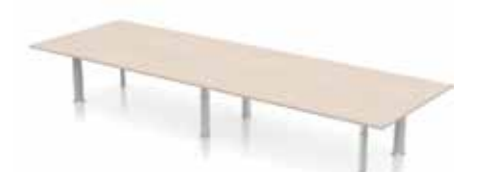
DELTA KONFERENZTISCH Säulen. Gestell in silber oder weiß. Verstellbarer Kickmechanismus.