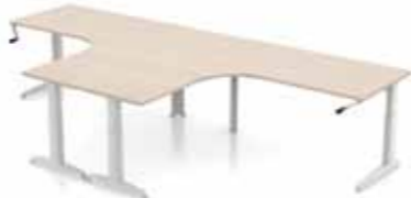
SCHREIBTISCH DELTA DUOMAX T- oder C-Tischbein. Gestell in silber oder weiß. Verstellbar Klick, manuell oder elektronisch 62-85 cm.