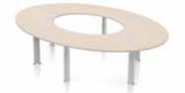
DELTA KONFERENZTISCH RUND GROSS Säulen. Gestell in silber oder weiß. Verstellbarer Klickmechanismus.