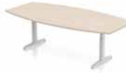
KONFERENZTISCH DELTA TONNE T-Tischbein. Gestell in silber oder weiß. Verstellbarer Klickmechanismus