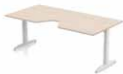
BUREAU DELTA ERGOCURVE 200 X 80 CM T- oder C-Tischbein. Gestell in silber oder weiß. Verstellbar klick, manuell oder elektronisch 62-85 cm.