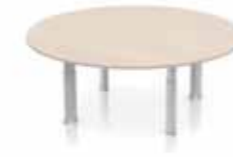
DELTA KONFERENZTISCH RUND KLEIN Säulen. Gestell in silber oder weiß. Verstellbarer Klickmechanismus.