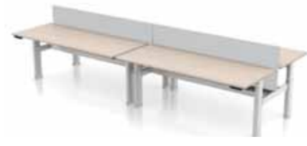
SCHREIBTISCH DELTA COMBIDESK 4X 180 X 80 CM H-Tischbein. Gestell in silber oder weiß. Verstellbar klick, manuell oder elektronisch 62-85 cm.