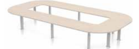
DELTA KONFERENZTISCH RUND Säulen. Gestell in silber oder weiß. Verstellbarer Klickmechanismus.