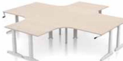
SCHREIBTISCH DELTA DUOMAX T- oder C-Tischbein. Gestell in silber oder weiß. Verstellbar klick, manuell oder elektronisch 62-85 cm.