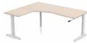
BUREAU DELTA MULTI 200 T- oder C-Tischbein + Säule Gestell in silber oder weiß. Verstellbar Klick, manuell oder elektronisch.