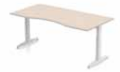
SCHREIBTISCH DELTA COMBI 200 X 80 CM T- oder C-Tischbein. Gestell in silber oder weiß. Verstellbar klick, manuell oder elektronisch 62-85 cm.