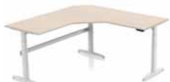
SCHREIBTISCH DELTA SITZ/STEH MEGASPACE 200 X 200 CM T- oder C-Tischbein. Gestell in silber oder weiß. Elektronisch verstellbar 62-128 cm.