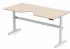
SCHREIBTISCH DELTA SITZ/STEH ERGOCURVE 200 X 80 CM T- oder C-Tischbein. Gestell in silber oder weiß. Elektronisch verstellbar 62-128 cm.