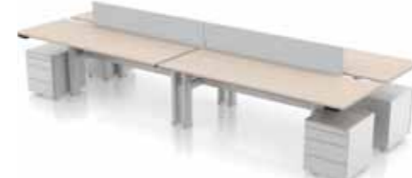
SCHREIBTISCH DELTA COMBIDESK 4X 200 X 80 CM H-Tischbein. Gestell in silber oder weiß. Verstellbar klick, manuell oder elektronisch 62-85 cm. Inklusive 4 HQ Schubladencontainern an den Enden.