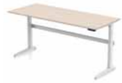
DELTA SITZ/STEH 200 X 80 CM T- oder C-Tischbein. Gestell in silber oder weiß. Elektronisch verstellbar 62-128 cm.