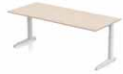
SCHREIBTISCH DELTA GERADE 200 X 80 CM T- oder C-Tischbein. Gestell in silber oder weiß. Verstellbar klick, manuell oder elektronisch 62-85 cm.