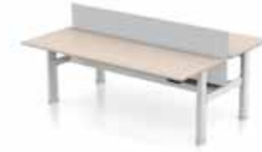
SCHREIBTISCH DELTA COMBIDESK 2X 160 X 80 CM H-Tischbein. Gestell in silber oder weiß. Verstellbar klick, manuell oder elektronisch 62-85 cm.