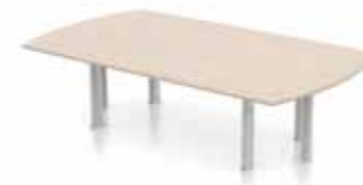
DELTA KONFERENZTISCH Säulen. Gestell silber oder weiß. Verstellbarer Klickmechanismus.